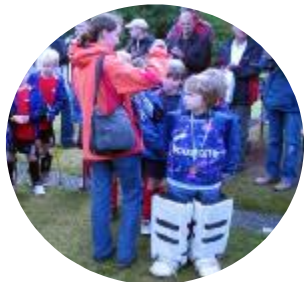
Betreuer, HockeyScout, Schiedsrichter, Trainer, ....