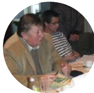
Vorstandsarbeit, Kontakte & Beziehungen, Finanzielle Unterstützung, ....